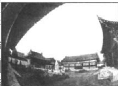
孙子的故里——孙子园。