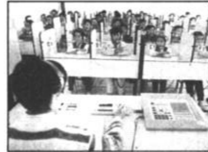
教育事业向电化发展。