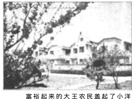
富裕起来的大王农民盖起了小洋楼。