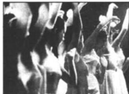
文艺事业蒸蒸日上。