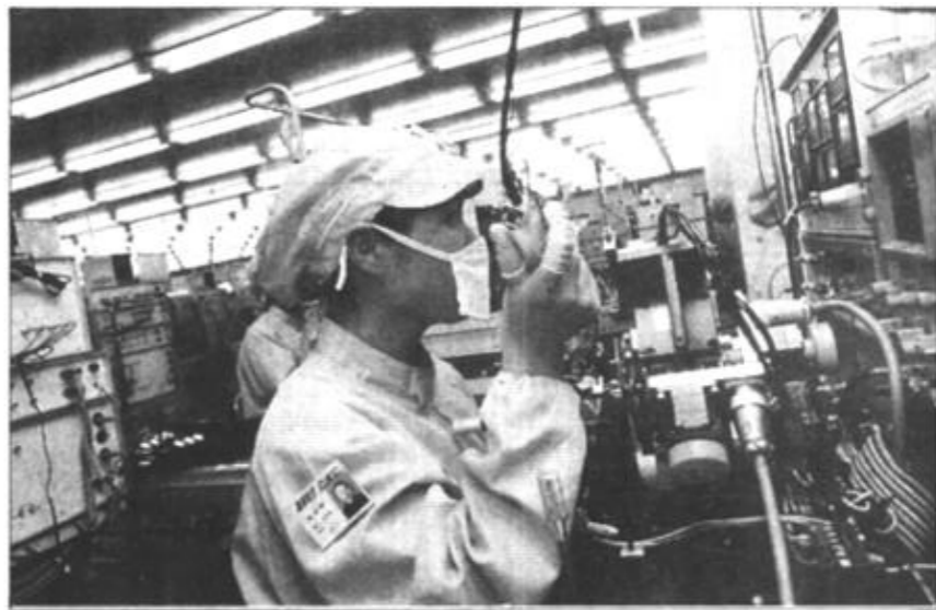
招商引资为我市的人员就业创造了良好的机会。