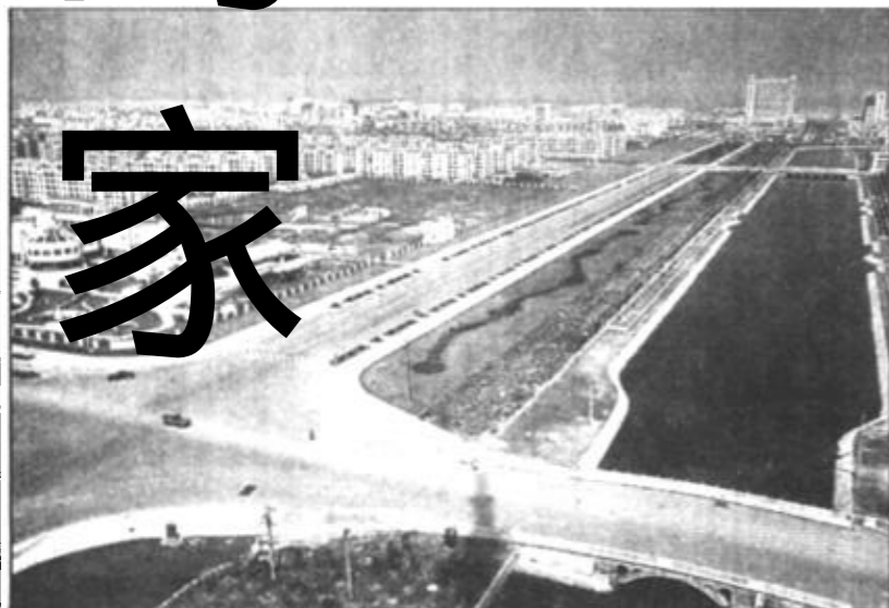
大绿地、大水面是我市城市建设的一大特色。