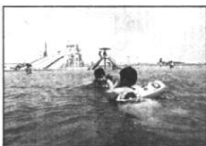
蓬勃发展的旅游业。