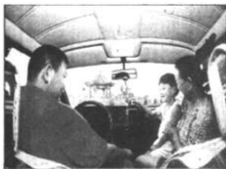
小轿车纷纷进入家庭，农民开上商务车早已不是稀罕事。