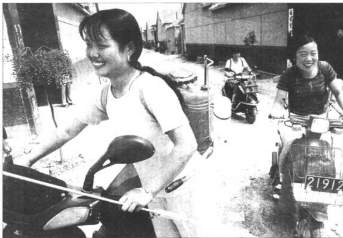
靠种植大棚蔬菜致富的农民们，如今已跨上摩托车下地了。