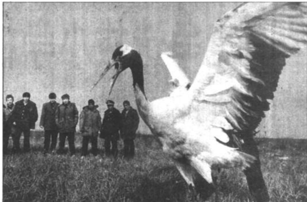
黄河三角洲国家级自然保护区内，丹顶鹤等珍禽自由飞翔。