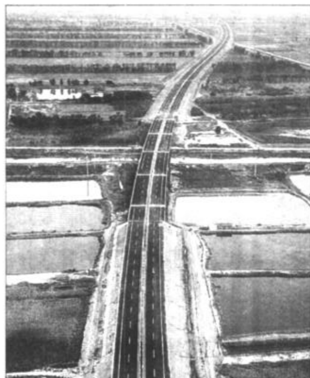
“九五”期间，全市新建高速公路132.8公里。