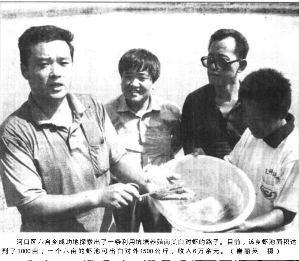
河口区六合乡成功地探索出了一条利用坑塘养殖南美白对虾的路子。目前，该乡虾池面积达到了1000亩，一个六亩的虾池可出白对对外1500公斤，收入6万余元。

本报讯 日前，市土地“五统一”管理领导小组第一次全体工作会议在市政府常务会议室召开。主要是进一步统一思想，明确职责，解决当前工作中的重点问题，全力推进土地“五统一”工作深入进行。