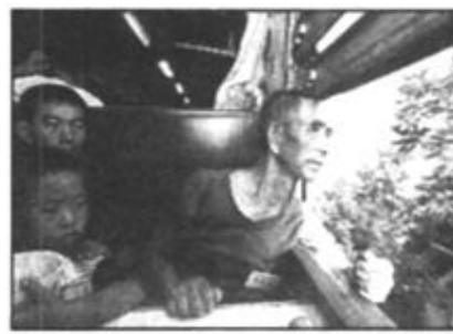
三峡移民落户我市。