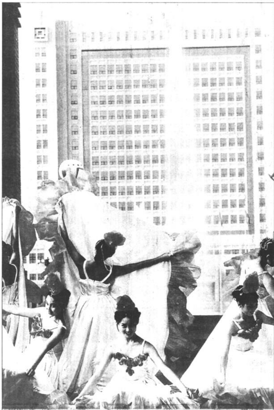
美丽的新世纪广场一派歌舞升平景象。