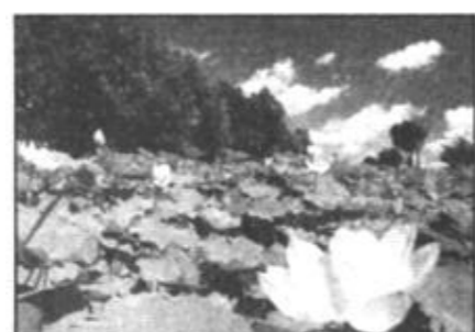
昔日荒碱地，今日荷飘香。