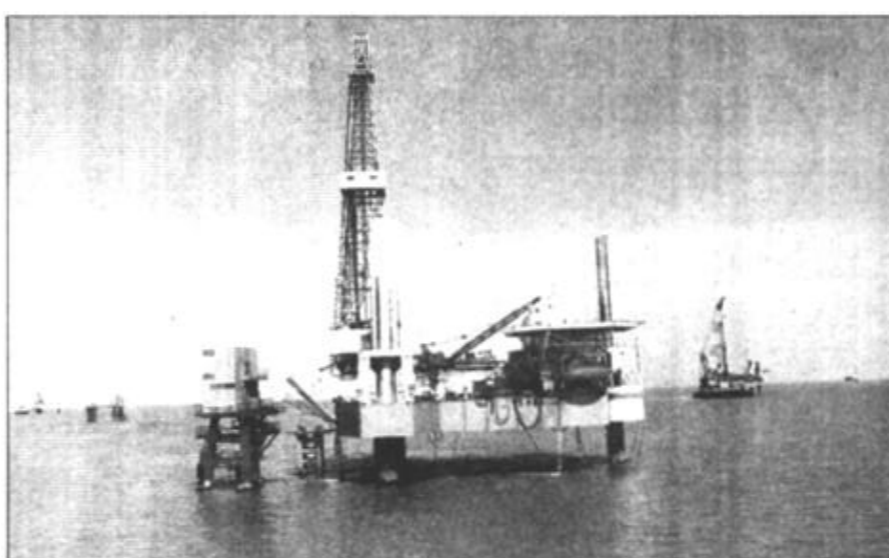
胜利油田在原油稳产、高产的同时，向大海进军。