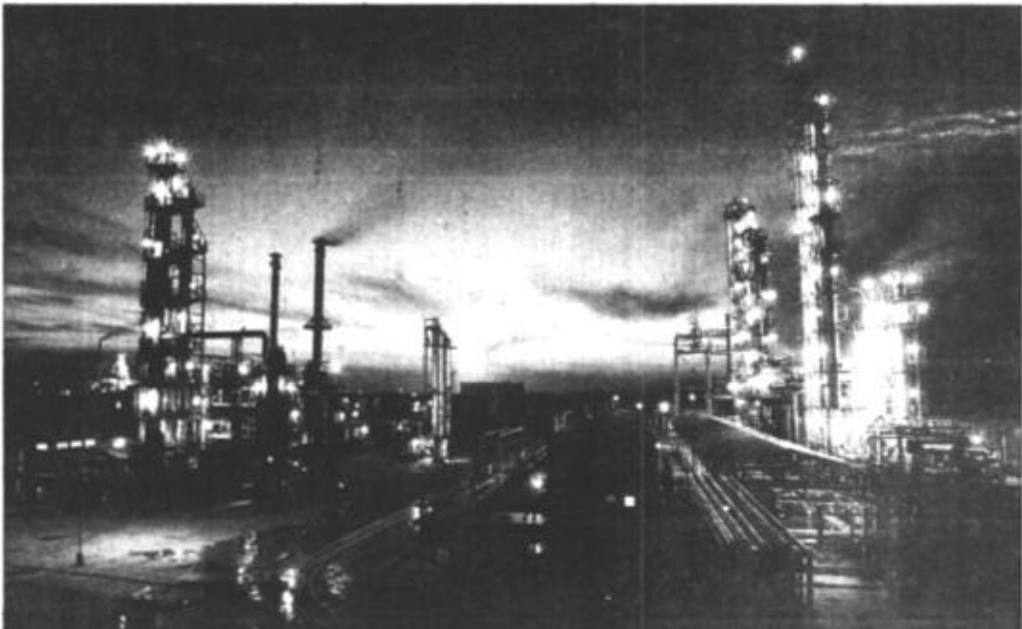
快速发展的石油化工，已成为我市的主要经济支柱之一。

海天空旷，大河奔奔，绿洲葱葱，蒹葭苍苍。纵横交织的公路，星罗棋布的水库，高耸入云的楼房，鳞次栉比的钻塔——年仅18岁的东营正在茁壮成长。长河、息壤展示出黄河三角洲的宏伟博大；绿洲、油田撑起了东营的生机勃勃。这里既有会生长的新淤地，也有古老的陆地。黄河入海口和国家级黄河三角洲自然保护区日益成为旅游探险的新“亮点”。南部则是中国春秋战国时期的齐国故地，我国古代著名的大军事家孙武就诞生在这里。 东营是万里黄河的海口城市，是中国第二大油田——胜利油田所在地，是黄河三角洲的中心城市，是山东省重点建设的能源、化工和农牧渔业基地。全市已经形成了以石油、石油化工、盐化工、机械、电子、造纸、纺织等为主体的工业体系。黄河三角洲农业综合开发是国家的重点项目，农业产业化、市场化、生态化水平不断提高。城镇居民人均收入和消费水平在山东省多年名列前茅。 百年陈酿，世纪辉煌，吻拍东营，心潮昂扬。黄色的黄河，蓝色的渤海，蓬勃的东营，可爱的家乡，让我们把这美丽的瞬间变成渊源流长。 撰文 陈谨之 图片编辑 高梓